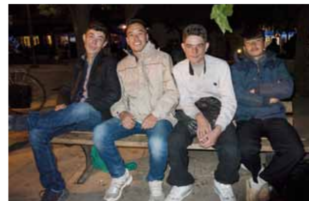
De här grabbarna har rest genom Afghanistan och Iran. De gick i ett dygn och fick gömma sig hela tiden.