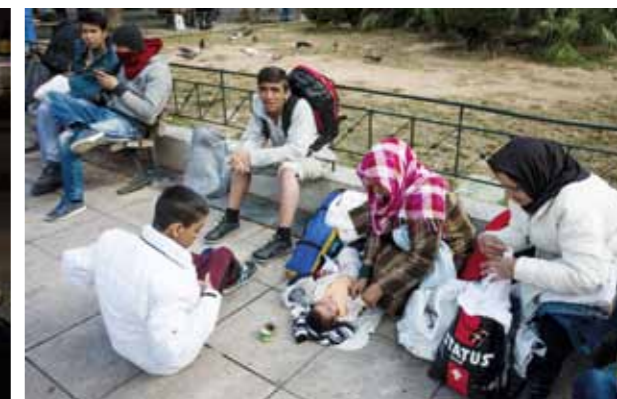
Många sover utomhus på marken efter resan över Medelhavet.